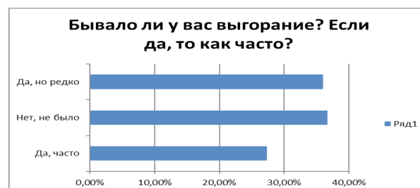
Рисунок 1 – Наличие состояния выгорания

По результатам проведенного анкетирования в опросе участвовали 150 студентов из них 3 курса – 62,1%, студенты 6 курса – 20,7% и 6,9% студенты – 1 и 2 курса. По факультетам ВУЗа специальности: «общая медицина» – 75,9%, «стоматология» – 10,3%, «технология фармацевтического производства» – 6,9%.