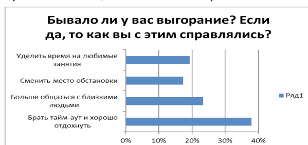
Рисунок 3 – Способы выхода из проблем эмоционального выгорания

На вопрос как респонденты справлялись с проблемой эмоционального выгорания большинство выбрали брать тайм-аут и хорошо отдохнуть как самый оптимальный способ выхода из состояния выгорания (38%), (23,3%) выбрали больше общаться с близкими людьми. Остальная половина выбрали уделить время любимым занятиям (19,3%) и (17,3%) сменить место обстановки. Можно сделать выводы, что студенты по-разному искали способы и методы выхода из проблемы эмоционального выгорания.